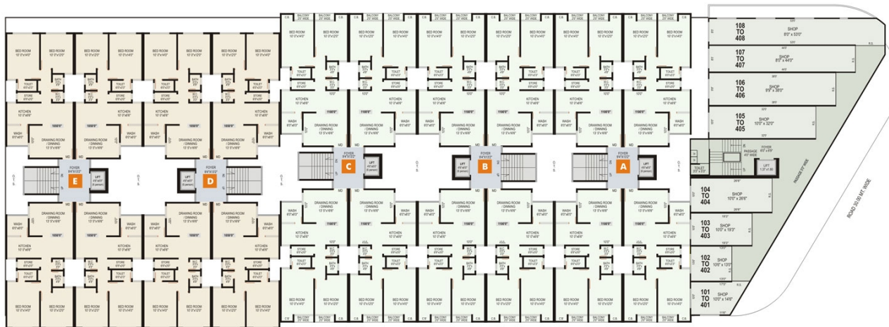
1st to 5th FLOOR PLAN- FLATS